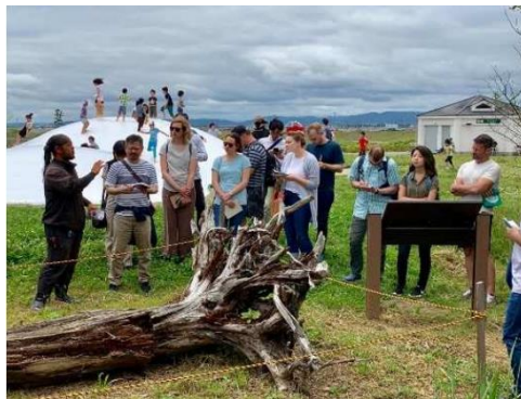
震災の痕跡の保存