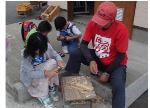
冒険あそび場エリア